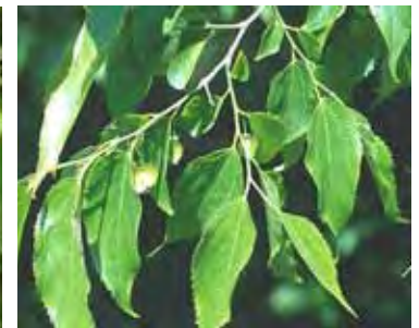
Malus perpetua 'Everest'